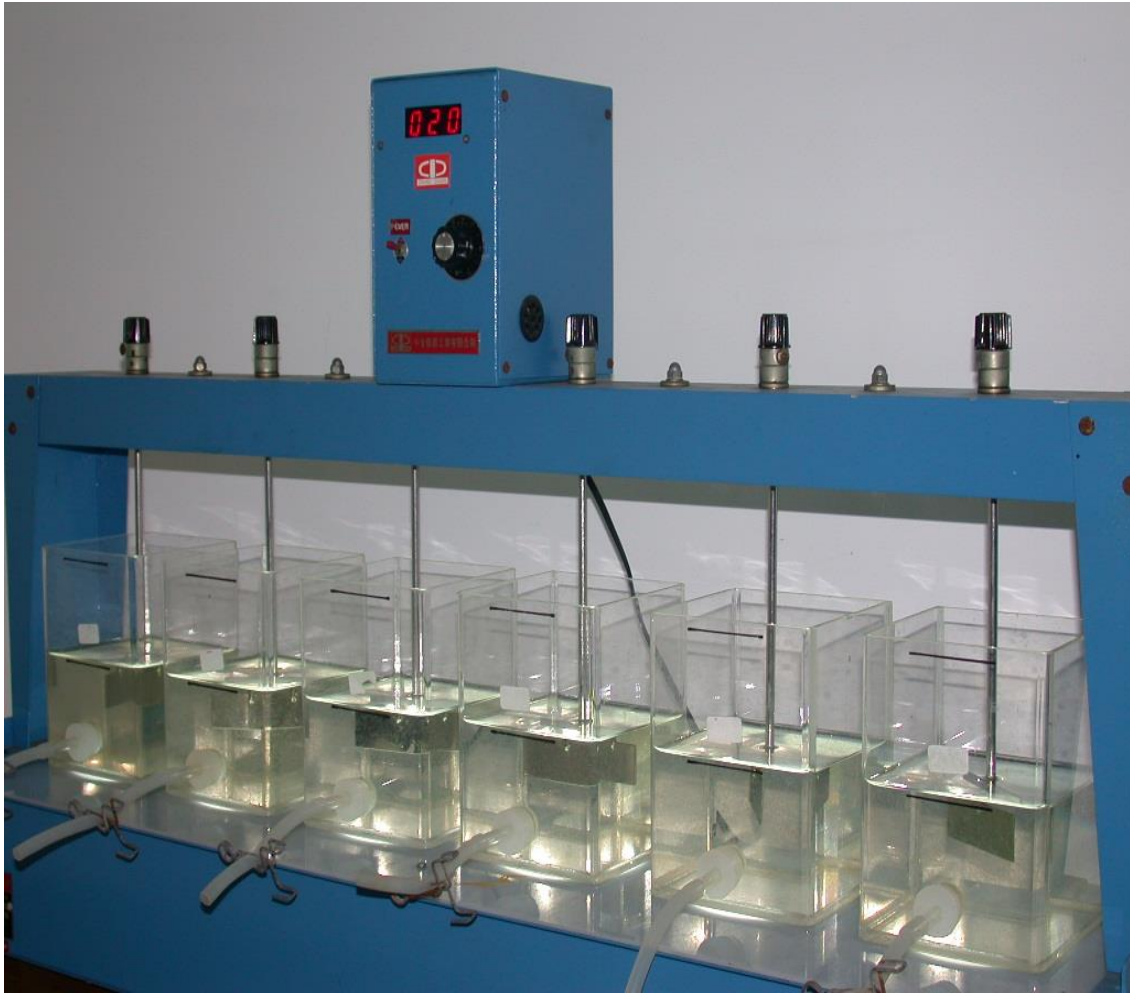
圖一: 混凝試驗攪拌機